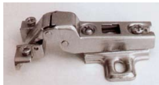
Zawiasy z serii Feniks idealnie współgrają z profilami aluminiowymi, dzięki czemu producent otrzymuje komplet komponentów o wysokiej, jednakowej jakości.

marki FENIX do frontów aluminiowych. Zawiera ona zawiasy nakładane, wpuszczane, przegrodowe, kątowe i równoległe. Serwis poszerza także możliwość frezowania pod inne niestandardowe puszki. Do końca 2007 r. w ofercie Fest pojawią się kolejne profile ramek aluminiowych, kolejne rodzaje stopek oraz zostanie rozszerzona liczba propozycji zawiasów.